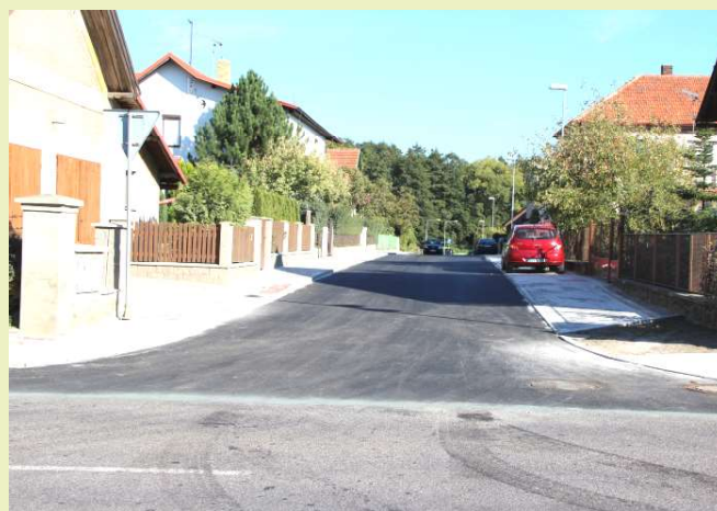
Ulice Máněsova v Uhlířských Janovicích během oprav a po rekonstrukci.