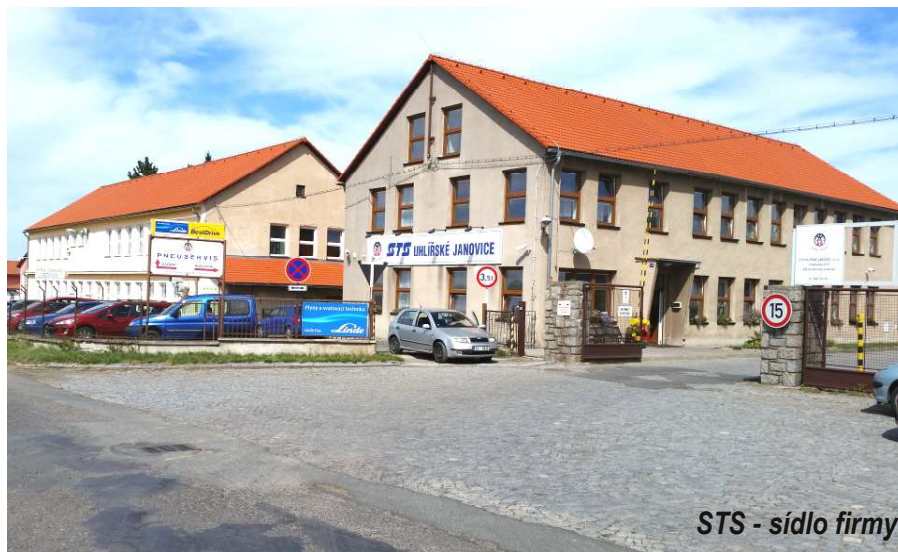
STS - sídlo firmy

Firma se řadí mezi strojírenské firmy, které mají v posledních letech stabilní výrobní program a počet zaměstnanců (kolem 60). Od svých obchodních partnerů má kladné reference na dodávané výrobky a splňuje náročné požadavky především na kvalitu a termíny pro tuzemské a zahraniční zákazníky. Za poslední roky společnost vytváří pravidelně zisk a úměrně ke svým možnostem ve finanční oblasti rozvíjí svoji výrobní základnu (rok 2014 patřil opět k úspěšnějším rokům firmy, dosaženo tržeb 80.951 tis. Kč při zisku před zdaněním 4.215 tis. Kč). Co se výše tržeb