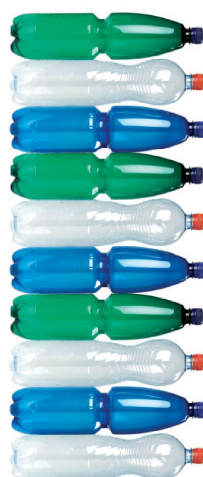
nesešlapané PET lahve 10 ks