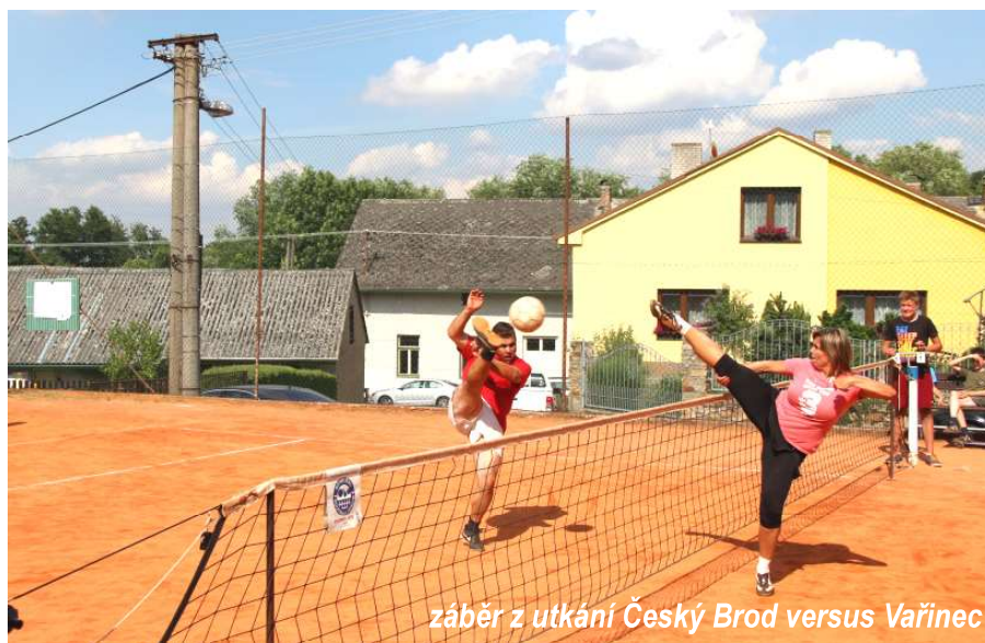
záběr z utkání Český Brod versus Vavřinec