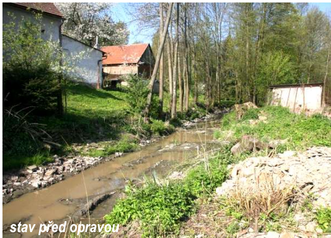
stav před opravou