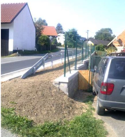
opravená zed' u silnice III. tř. ve Vavřinci