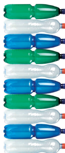
nesešlapané PET lahve 10 ks