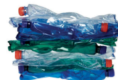
sešlapané PET lahve 10 ks