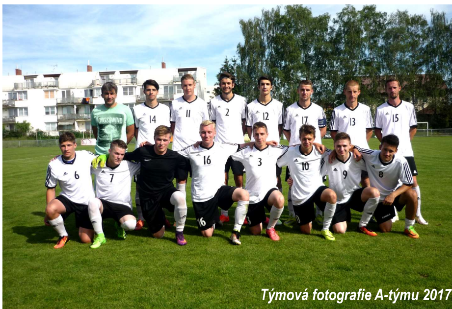
Týmová fotografie A-týmu 2017

„Prvních dvacet minut bylo vyrovnaných, ale soupeř měl větší šance. Domáci dokonce