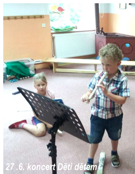
27. 6. koncert Děti dětem