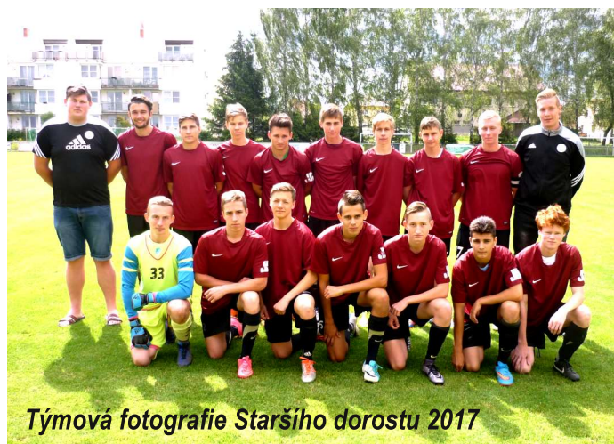
Týmová fotografie Staršího dorostu 2017