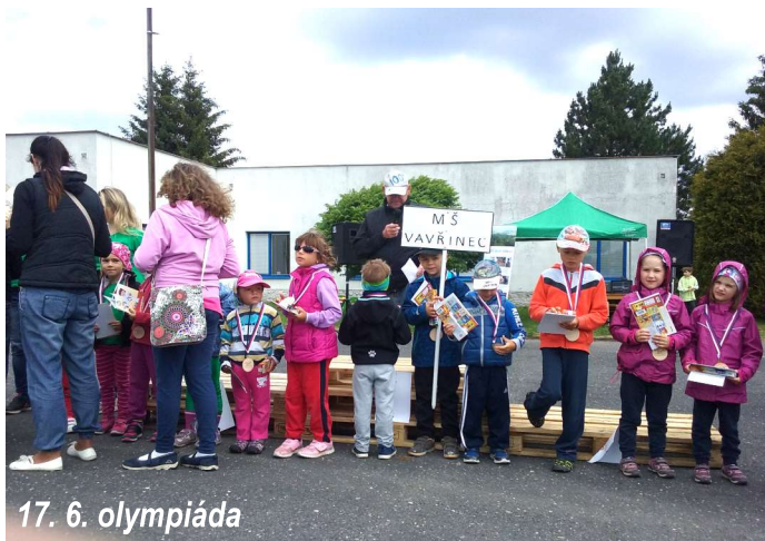
17. 6. olympiáda