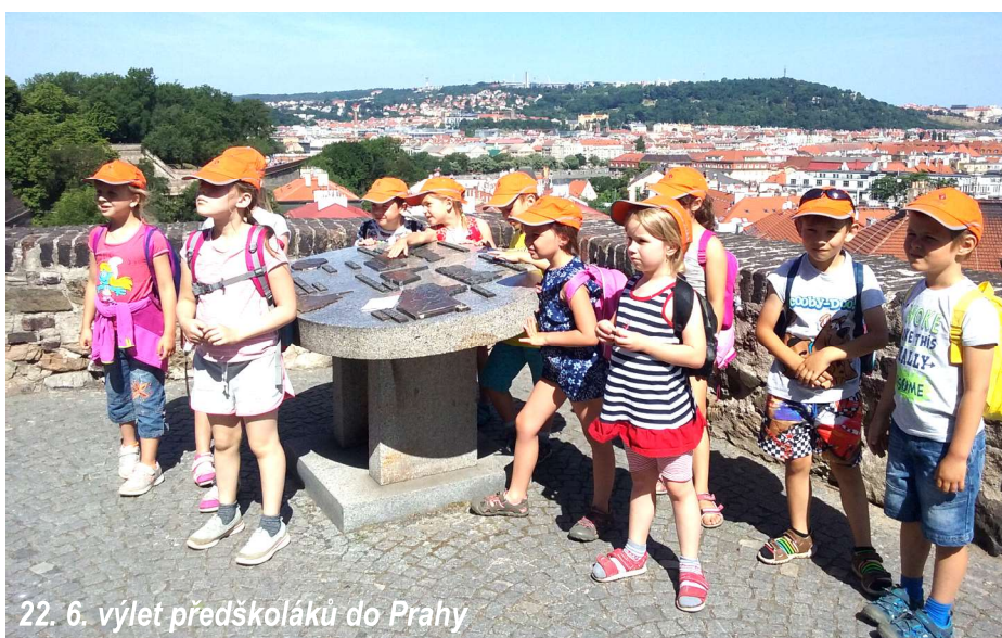
22. 6. výlet předškoláků do Prahy