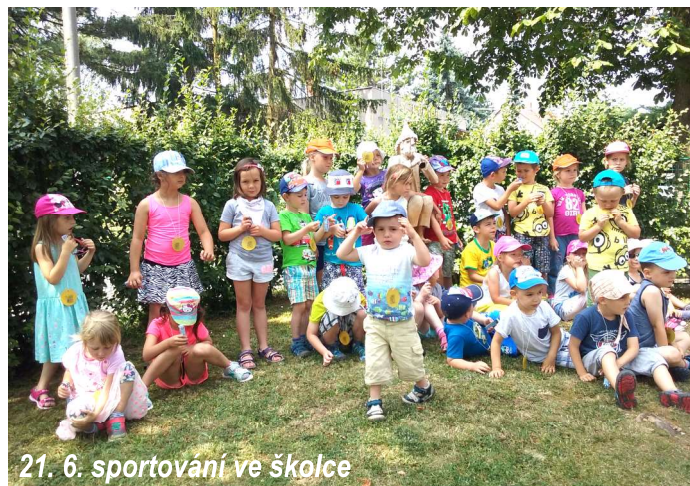
21. 6. sportování ve školce