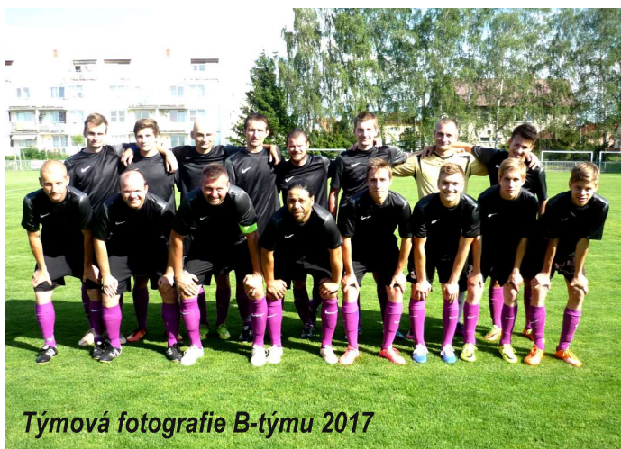
Týmová fotografie B-týmu 2017

Detailní statistiky všech týmů FK Uhlířských Janovic naleznete na www.fkuhlirskejanovice.cz