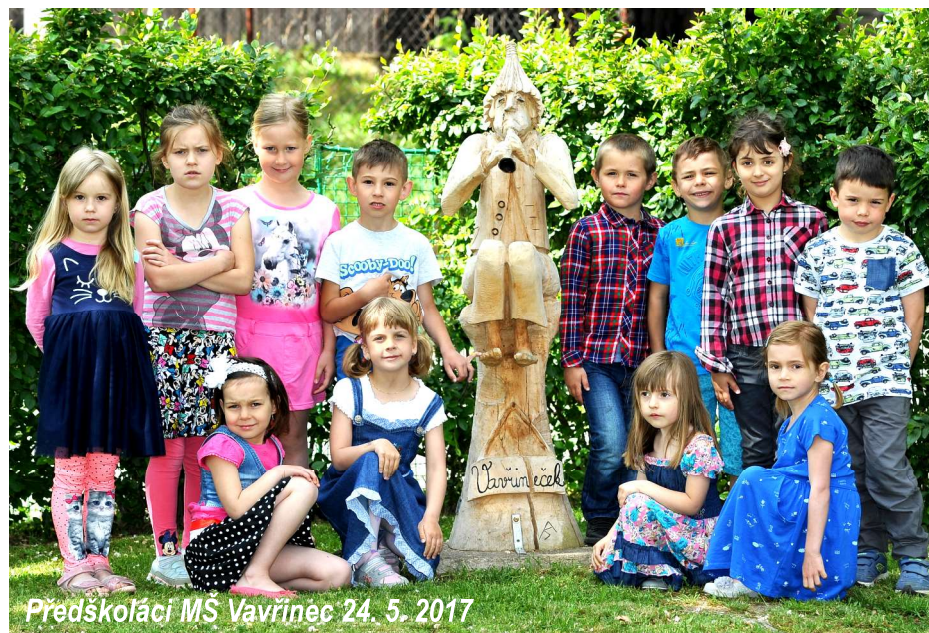
Předškoláci MŠ Vavříneček 24. 5. 2017

Trošku se mi bude stýskat po dětech, které vstupují do další etapy svého života. Z předškoláků se od 4. září stanou školáci a já bych jim chtěl moc a moc přát, aby proplouvali životem stejně bezsta-