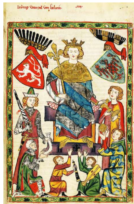
Král Václav II., druhý doložený majitel Beřic