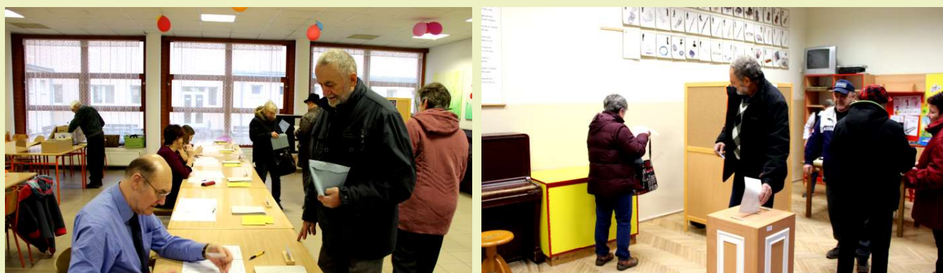
Záběry z 1. kola prezidentských voleb v Uhlířských Janovicích. Na prvním snímku je záběr z jídelny ZŠ při kontrole dokladů voličů, na druhém pak volba v budově 1. stupně ZŠ.