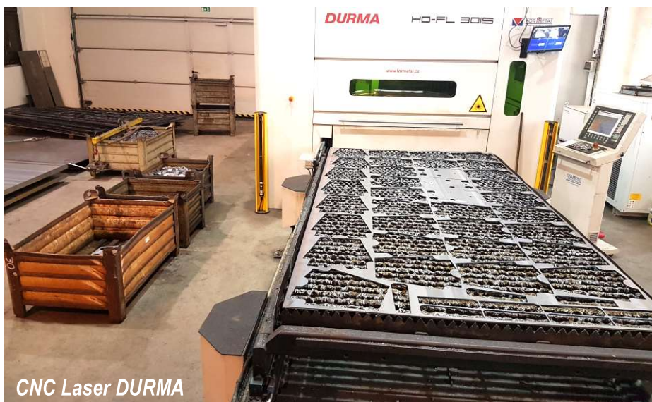
CNC Laser DURMA

Kromě nových investic vynaložila firma v uplynulých pěti letech 17 mil. do oprav strojů, budov a zpevněných ploch, oplocení apod. Sami mohou zákazníci nebo občané Uhlířskojanovicka posoudit, jak se vzhled firmy v posledních