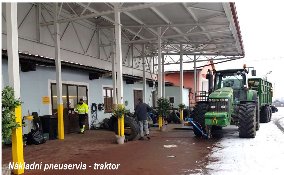
Nákladní pneuservis - traktor

Firma navázala na více jak 40letou tradici Strojní a traktorové stanice zaměřenou na strojírenskou výrobu s významným objemem exportu výroby, kovoobráběčství, pneuservis, obchodní činnost se zvláštním zřetelem na prodej výměnného fondu, pneumatik a další již nevýznamné aktivity. Protože se domácí trhy rozpadly, byla