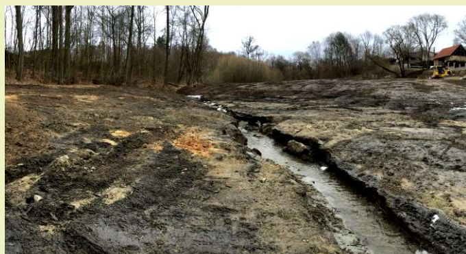
Odbahnění rybníka v obci Čestín

V obci Čestín se nachází rybník, který nese název Hluboký rybník. Odbahnění rybníka vždy bylo, je a pevně věřím, že i v budoucnu bude pro obec velkou událostí, která se neopakuje s výraznou intenzitou. A právě v tomto roce odbahnění Hlubokého rybníka probíhalo.