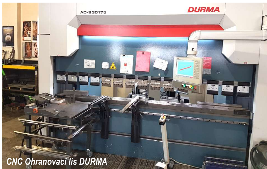
CNC Ohranovací lis DURMA

Ani firmě STS Uhlířské Janovice, s. r. o., se v minulých letech nevyhýbaly takové jevy, jakým byla krize v letech 2008 až 2009. V tomto období z důvodu poklesu zejména zahraničních zakázek poklesly tržby z 80 mil. Kč na 50 mil. Kč a firma se musela rozloučit se 37 zaměstnanci z původních 80. I přes tento pokles tržeb a počtu zaměstnanců se firma během dalších dvou let stabilizovala a již v roce 2011 zvýšila tržby téměř na původní úroveň 80 mil. Kč s 59 zaměstnanci. Dalším významným mezníkem firmy je rok 2017, ve kterém byl dosažen obrat firmy ve výši 101 mil. To je k předchozímu roku 25% nárůst při pouhém nárůstu o 4 zaměstnance.