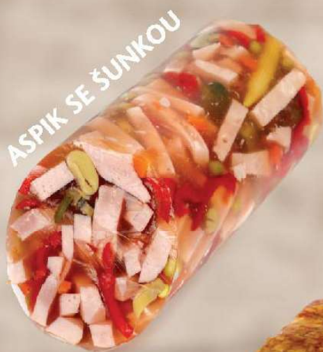
ASPIK SE ŠUNKOU