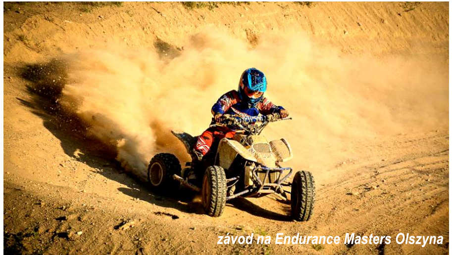
závod na Endurance Masters Olszyna

OffROAD Maraton je seriál vytrvalostních závodů motorek, čtyřkolek a aut, a je složen z osmi závodů (jaro až podzim) po celé ČR. Jedná se o otevřené mistrovství a zúčastnit se mohou i zahraniční jezdci. Na těchto závodech jezdí dospělí i děti v