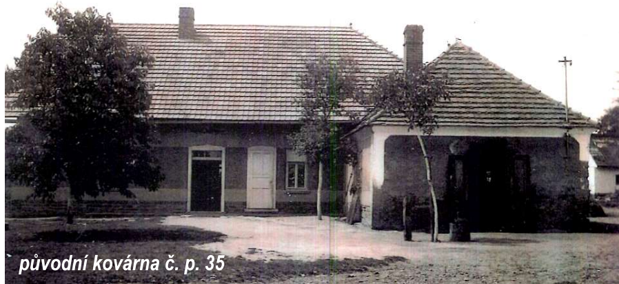
původní kovárna č. p. 35