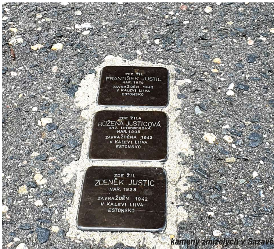
kameny zmizelých v Sazavě