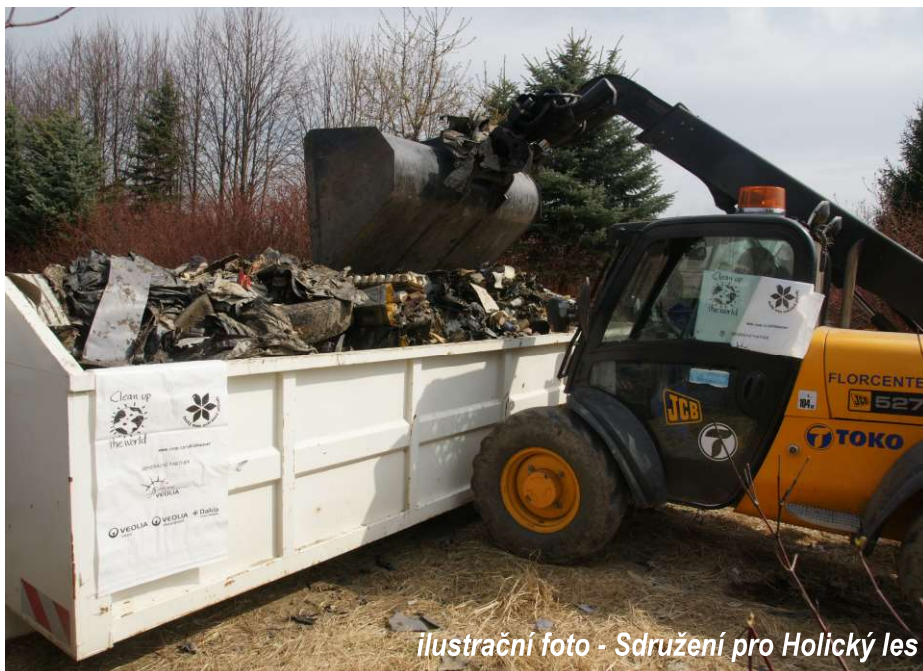
ilustrační foto - Sdružení pro Holický les