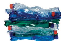
sešlapané PET lahve 10 ks