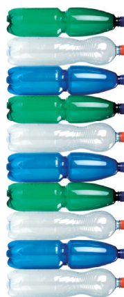
nesešlapané PET lahve 10 ks

Zdarma zveřejníme vaše pozvánky na koncerty, obecní slavnosti, divadla či výstavy. V případě zájmu kontaktujte, prosím, redakci.