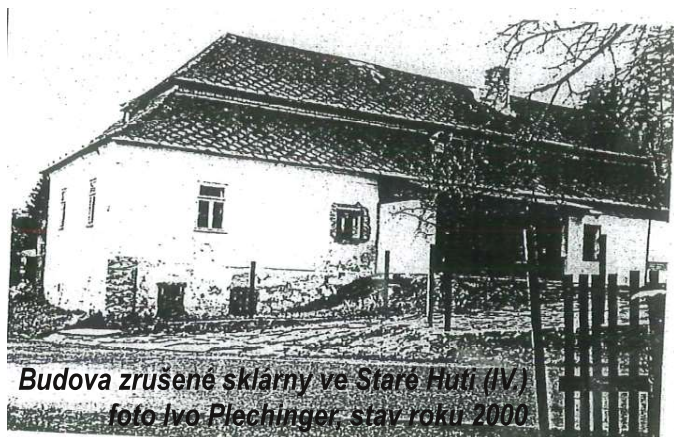
Budova zrušené sklárny ve Staré Huti (IV) foto Ivo Plechinger, stav roku 2000