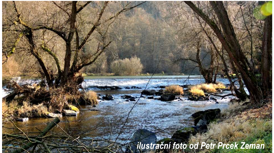
ilustrační foto od Petr Prcek Zeman

Zahajování vodácké sezóny je ve středních Čechách spojeno