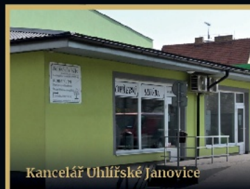
Kancelář Uhlířské Janovice