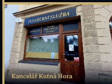
Kancelář Kutná Hora