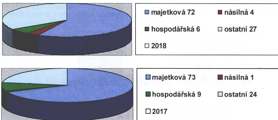
Podíl druhů trestné činnosti za rok 2018 a 2017

Zde se jedná především o trestné činy spáchané při dopravních nehodách, nebo v souvislosti s provozem na pozemní komunikaci, případně trestné činy od počátku šetřené Službou kriminální policie a vyšetřování. Jedná se například o trestné činy sprejství, nebo „Ohrožení pod vlivem návykové látky“. Této trestné činnosti bylo v roce 2018 celkem 31 případů, kdy došlo k nárůstu oproti roku 2017, kdy bylo 23 případů a objasněnost se průměrně pohybuje kolem 63%.